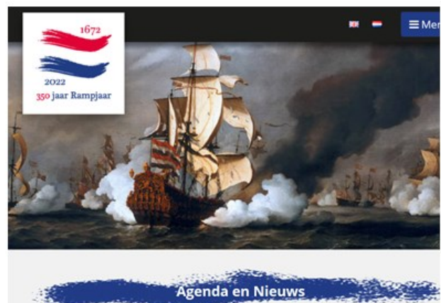
De website bevat een agenda van alle activiteiten