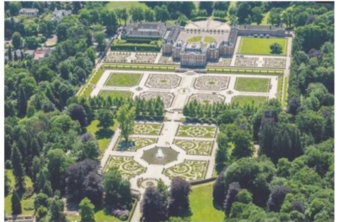
In 2011 opent het gerestaureerde Paleis Het Loo zijn poorten

Alle herdenkingsactiviteiten in 2022 kunnen rekenen op warme belangstelling van de media. Zo hebben NPO en Omroep Max plannen voor documentaire series en heeft www.maandvandegeschiedenis.nl als thema voor 2022 gekozen: Wat een ramp!