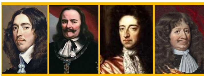
Belangrijke personen in het Rampjaar: De Witt, Willem III, De Ruyter en Rabenhaupt

Het Rampjaar was een jaar van dramatische gebeurtenissen, ook een keerpunt in de Gouden Eeuw. Een jaar om bij stil te staan, met belangrijke en tot de dag van vandaag niet te missen lessen voor jong en oud. Over nationale vrijheid en wat die kost en brengt. Vrijheid die bevochten werd mét het water en óp het water.